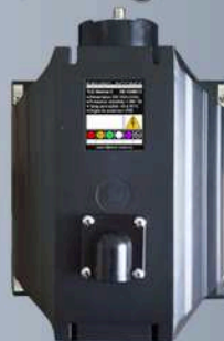
Photographie du dos d'un TLE11-V2