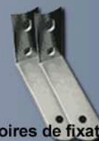
Accessoires de fixation DTL01